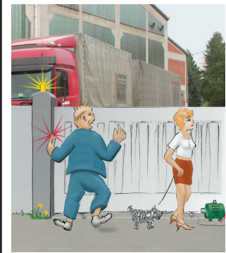
Kraftbetätigte Torschließung durch Elektromotor.